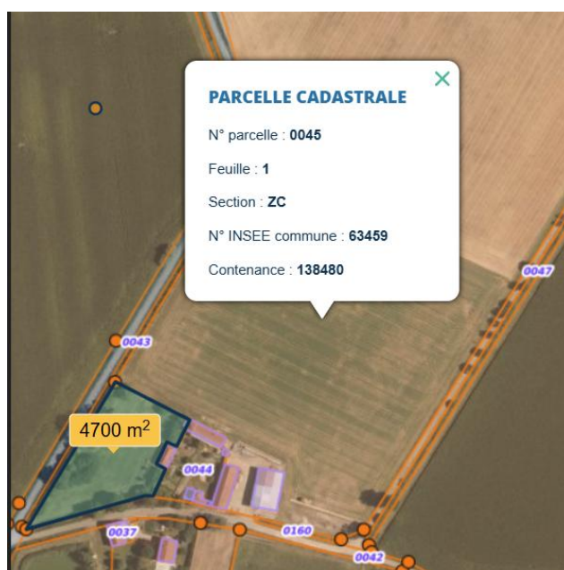
Zone constructible de la parcelle ZC - 0045 suivant le PLU de 2007